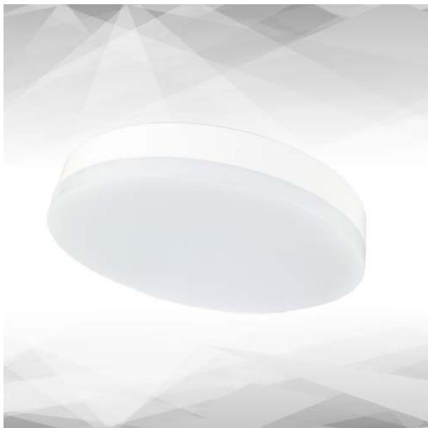
Abbildung TILIA Round