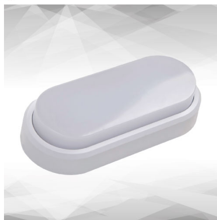
Abbildung TILIA Round