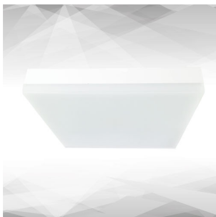
Abbildung TILIA Square