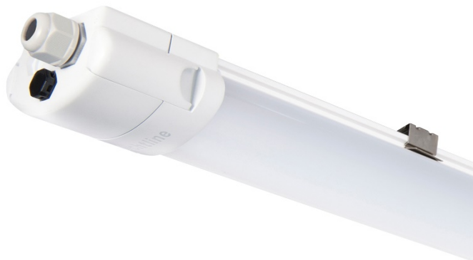
Abbildung FARO X3