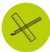
Planung / Amortisation