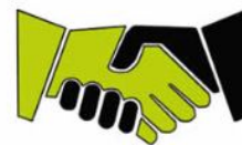
Angebot & Auftrag